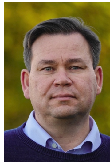
Artiklens forfatter: Henrik Koch Rasmussen

Artiklen er udgivet på www.fritid-samfund.dk 30. november 2023.