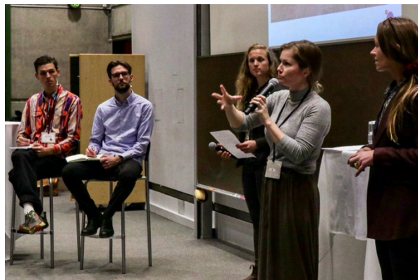
Gruppearbejde om partnerskaber ved Folkeoplysningens Dag